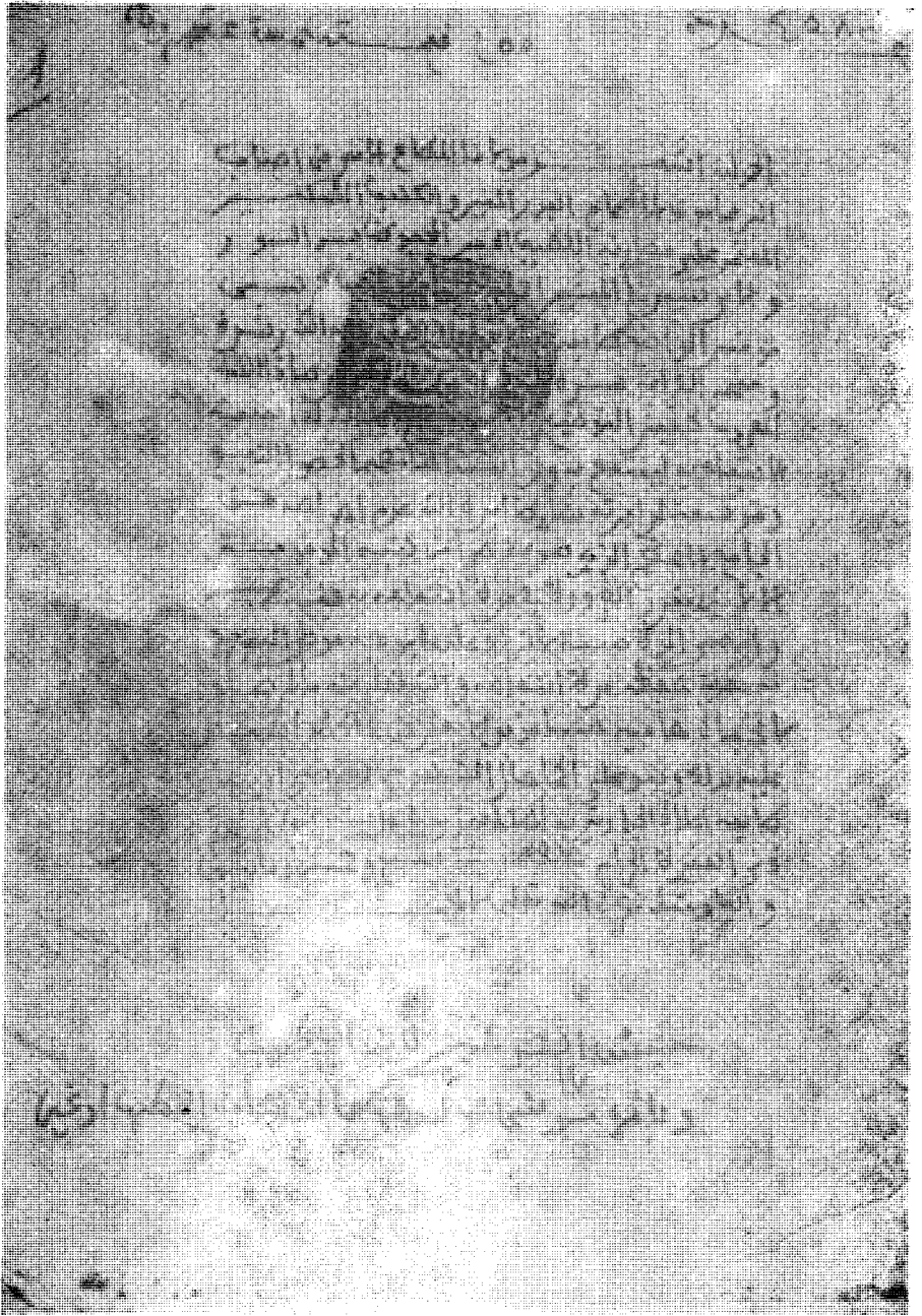
نموذج الورقة الاولى من مخطوطة الزيتونة وقد تضمنت تحييس احمد باي لكتاب جيش التوشيح هذا على الجامع الاعظم بتونس سنة ١٢٥٧ هجرية